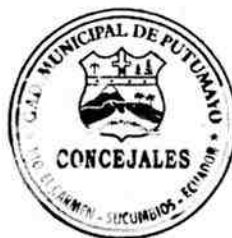
Lcdo. Fidel Castro.

Esto es todo en cuanto puedo informar para los fines legales consiguientes.