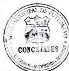
Lcdo. Fidel Castro.

Esto es todo en cuanto puedo informar para los fines legales consiguientes.