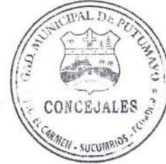
Lcdo. Fidel Castro.

Esto es todo en cuanto puedo informar para los fines legales consiguientes.