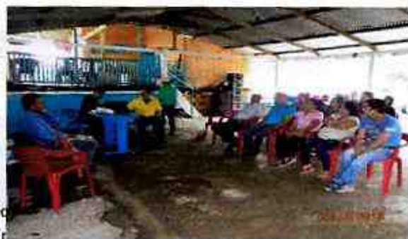
Putumayo – Sucumbíos – Ecuador