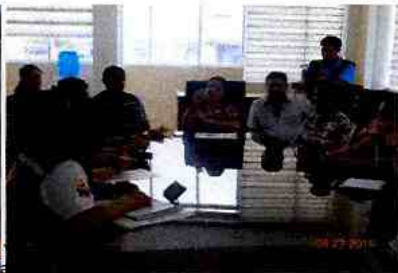
Putumayo – Sucumbíos – Ecuador